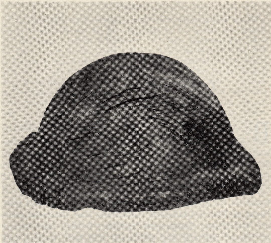
Fig. 1. Den først fundne Hjælm, set fra Siden.

af Mosen 1\frac{1}{2} m tykt, men aftager i Tykkelse mod Bredderne. Under Tørven findes et Lag Dynd (»Gytje«) med mange Snegle- og Muslingeskaller og saaledes stærkt kalkholdigt; dette er dannet i aabent Vand, medens Mosen endnu var en aaben Sø. Sumptørven, der har forvandlet Søen til Mose, er groet fra Bredden udefter, saaledes at Grænsen mellem Gytjen og Tørven stort set er ældst nær Bredden og yngst i Midten af Mosen, hvor Tilgroningen er foregaaet senest. Det er i dette Grænselag mellem Gytje og Sumptørv, at Oldsagerne er fundet, men paa forskellige Steder i Mosen, uden at det nu er muligt nøjere at stedfæste de enkelte Sager; en pollenanalytisk Undersøgelse af Mosen vil derfor næppe kunne føre til nogen sikker Datering af Hjælmene.