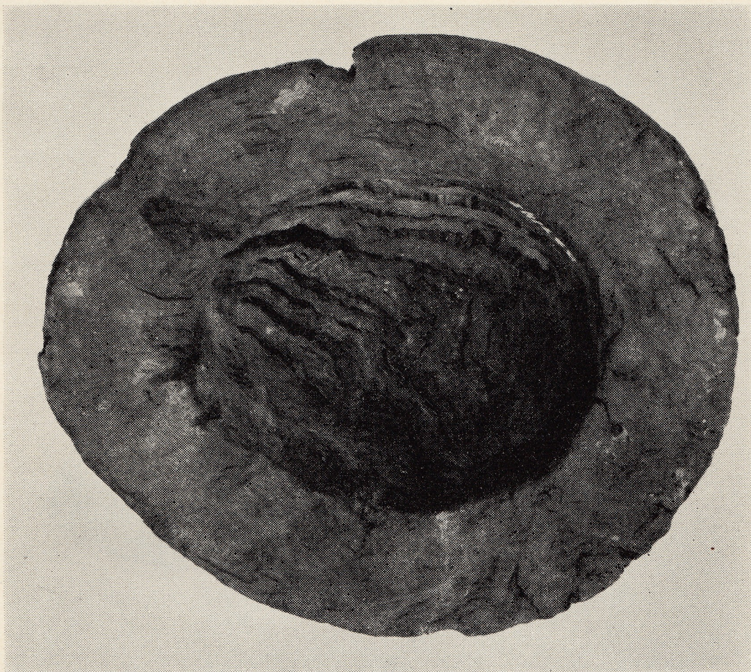
Fig. 2. Den først fundne Hjælm, set fra Undersiden.

lodrette indridsede Striber og Randen med en Række Gruber, dannet ved at stikke med en Pind; dette Kar stammer fra Yngre Stenalder, nærmere betegnet Slutningen af Dyssetiden, omkring 2200 før Kristi Fødsel. En Grønstensøkse med Skaftthul, der dog ikke er boret færdig, af den Slags, der plejer at kaldes Arbejdsøkse, en plump og tung Økse. Den tilhører Slutningen af Stenalderen, Dolktiden, 15—1600 før Kristi Fødsel. Et Skaar af et Lerkar med Hank, antagelig fra Ældre Romersk Jernalder, de første Par Aarhundreder efter Kristi Fødsel. En Kastespydspids, dannet ved at tilspidse en hul Knogle, ogsaa fra Ældre Jernalder. Dernæst nogle Sager, hvis Tid ikke nærmere kan bestemmes: Kranium af en voksen Mand; Brudstykker af to Barnekranier, begge med Kraniebrud, frembragt ved Slag med en Kølle eller lignende; talrige Knogler og Kraniedelev af Okse og Svin.