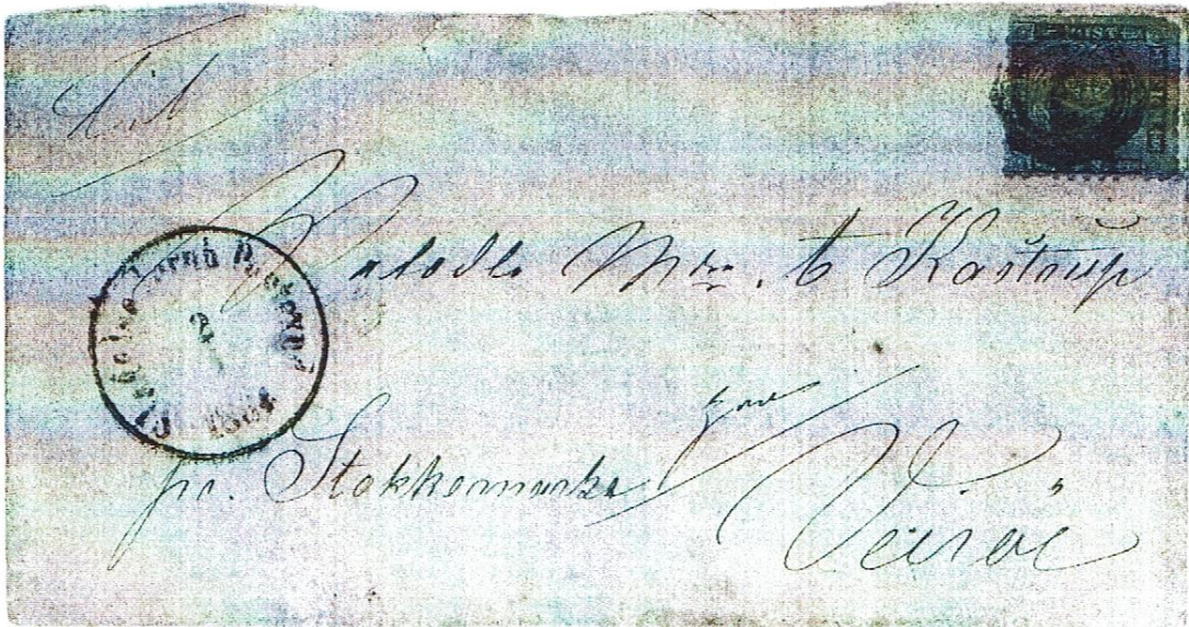
Brev sendt 2. april 1864 fra Slagelse til Veirø via Stokkemærke, som fastlagt ved cirkulæret af 17. maj 1859.

Et var så at komme til Fejø efter posten, et andet var at komme fra landingsstedet på nordkysten til postekspeditionen i Vesterby og retur til båden. Den dobbelte transporttid hertil skulle lægges oven i sejladstiden. I alt et anseeligt tidsforbrug til en befolkningsmængde, der ikke på noget tidspunkt har oversteget 75 personer i de 4 gårde og 8 huse på øen, og som næppe postalt har været i stor forbindelse med omverdenen uden for øerne i Smålandsfarvandet.