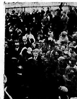
Kongen passerer gennem Folkemøder ved Fejø Havn.