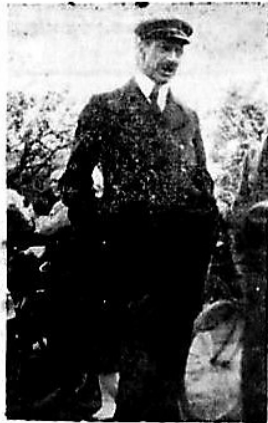
Kongen siger noget paa Femø.

Fra Havnen gik Turen til Osterby Skole, hvor Børnene sang for Kongeparret, og derfra videre til Vesterby Skole, hvor Majestæterne ligeledes trakteredes med Sang! Besøget i Skolerne efterfulgtes af en lille Visit i Kirken, hvorefter